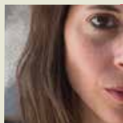
CALAFELL, Mireia España 1980

Poeta y narrador. Viajero. Lleva publicados quince libros de poesía, cuatro tomos de memorias de viaje, un libro de cuentos y una novela. Se han publicado en España y México dos tomos de su trilogía Los devoradores de caballos , poema épico finalizado en 2015. Está traducido parcialmente a varios idiomas. Nominado dos veces al Premio Nórdico (2000 y 2005). Recibió el Gran Premio de la Academia Danesa (2012). Su poesía ha sido traducida a varios idiomas. Reside en Copenhague.