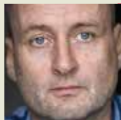
BOBERG, Thomas Dinamarca 1960

Poeta y narrador. Viajero. Lleva publicados quince libros de poesía, cuatro tomos de memorias de viaje, un libro de cuentos y una novela. Se han publicado en España y México dos tomos de su trilogía Los devoradores de caballos , poema épico finalizado en 2015. Está traducido parcialmente a varios idiomas. Nominado dos veces al Premio Nórdico (2000 y 2005). Recibió el Gran Premio de la Academia Danesa (2012). Su poesía ha sido traducida a varios idiomas. Reside en Copenhague.