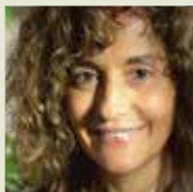
CORNEJO, Sandra Buenos Aires, Argentina 1962

Poeta y narrador. Publicó Justo al final de la noche (1992), Salidas (1994), Geografías (1998), -traducido al checo, ruso, ucraniano, polaco y español rioplatense-, Distancias (2003), Trenes (2008), Camus tiene que morir (2013), Diorama del Este (2014). Cuentos suyos han aparecido en La Nouvelle Revue Française , el Corriere della Sera , en la página web literaria Nazioneindiana , y en las revistas l'Índice , Diario , y l'immaginazione . Dirige 'Café Golem', la sección cultural de Eastjournal.net .